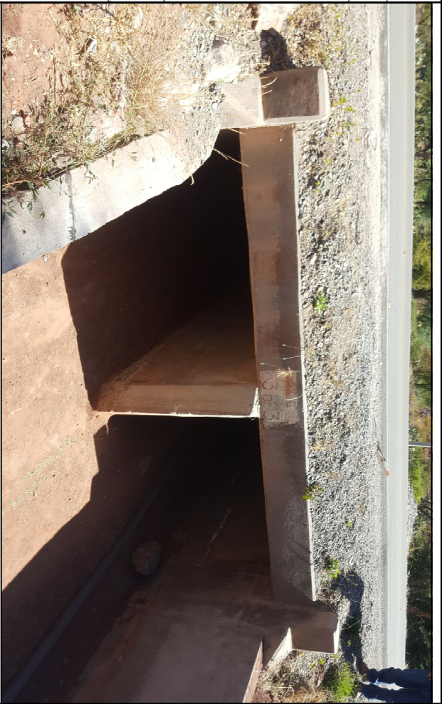
VISTA SUPERIOR - CRUCE DE ALCANTARILLA CON FUNDA METÁLICA Y DADOS DE HORMIGÓN